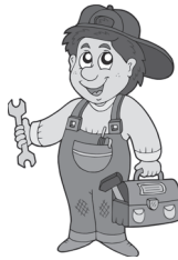
repairman opravář opravár