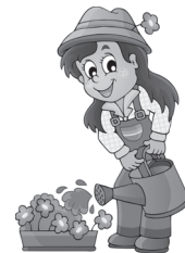
gardener zahradnice zahradníčka