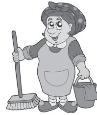
cleaning lady uklížečka upratovačka