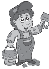
painter malíř maliar