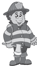
fireman hasič hasič