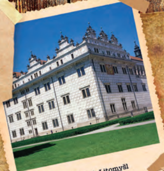
Státní zámek Litomyšl